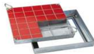
BV delno zapolnjen s ploščicami