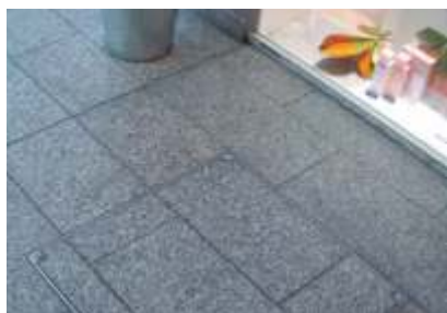
BV v tleh kavarne z granitnim zaključkom