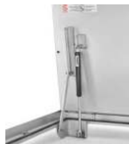
Detajl: plinski amortizer in varnostna naprava