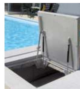
BVE-GD 88 vgrajen v a območje bazena